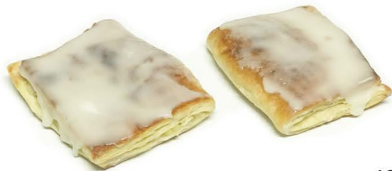
ciasto francuskie z jabłkami