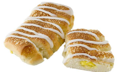
grzebień z budyniem