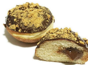
pączek z czekoladą i imbirem