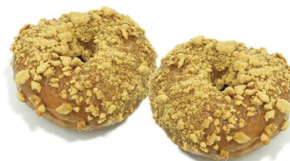
pączek z biscoffem