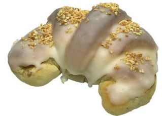
rogal z białym makiem specjalne zamówienie 48hrs