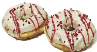
pączek z białą czekoladą i malinami