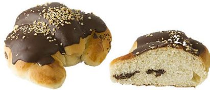
rogal w czekoladzie