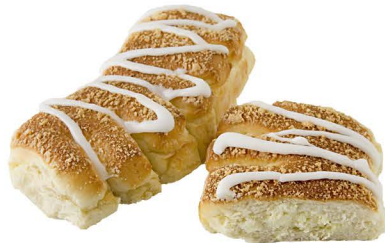
grzebień z serem