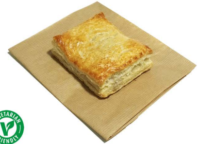
pasztecik sera i cebuli