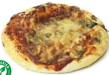
pizza z pieczarkamiza