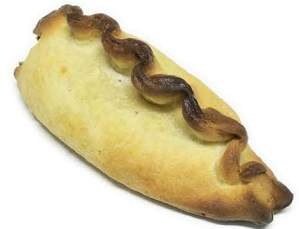
paszteciki z wołowiną i warzywami