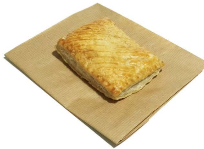
pasztecik z kurczaka