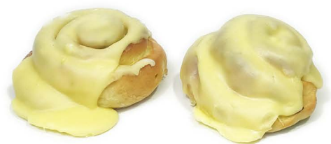
cytrynowa bułka belgijska