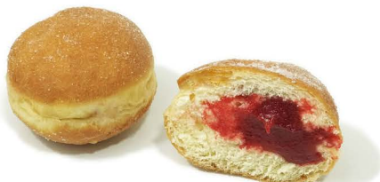
pączek z dżem wieleoowoc