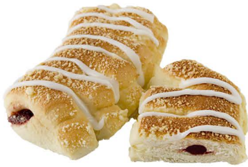
grzebień z marmoladą